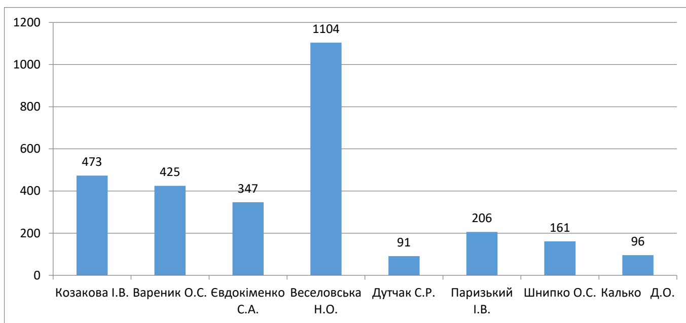
Рис.2. Рейтинг науково-педагогічних та педагогічних працівників кафедри публічного та приватного права за 2019-2024 роки, бали

Сума балів, набраних за результатами оцінювання видів робіт є основою для визначення рейтингу науково-педагогічних та педагогічних працівників.