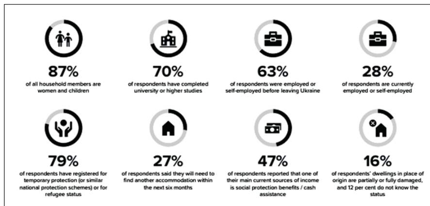
Мал. 1. Профілі біженців та їхня соціально-економічна ситуація

дено умовні профілі біженців і осіб, які отримали тимчасовий захист, та їхнє соціально-економічне становище. Зазначимо, що 90% біженців становлять жінки та діти, водночас 70% дорослих мають вищу освіту. Значна частина біженців уже отримали роботу та майже всі відправили своїх дітей до шкіл у приймаючих країнах.